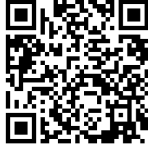
ใบสมัครนิติสมาชิก วสท.