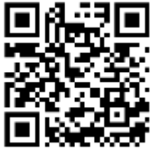
ลงทะเบียนเข้าร่วมโครงการ และดาวนโหลดใบสมัคร