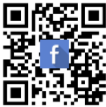
FB: วิศวกรดีมีจรรยาบรรณ