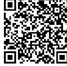
จรรยาบรรณ วสท. พ.ศ. 2556